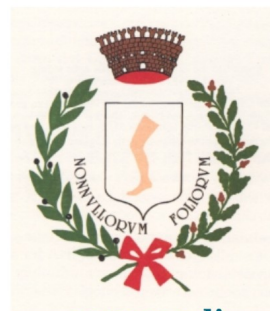
comune di Gambettola